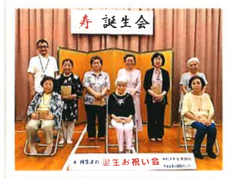
「4・5・6月誕生お祝い会」