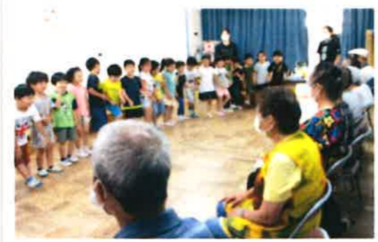
「七夕交流会」 3年ぶりの園児との交流会です!