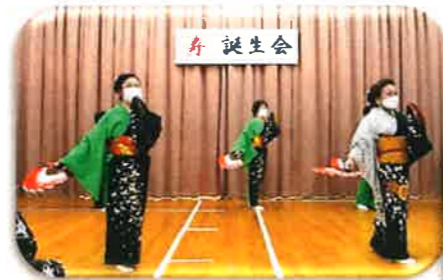
民舞サークルによる舞の披露