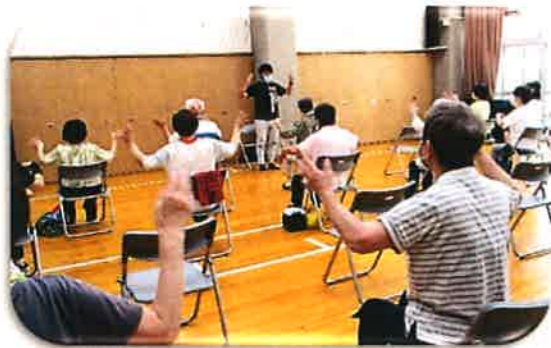
「体幹エクササイズ」