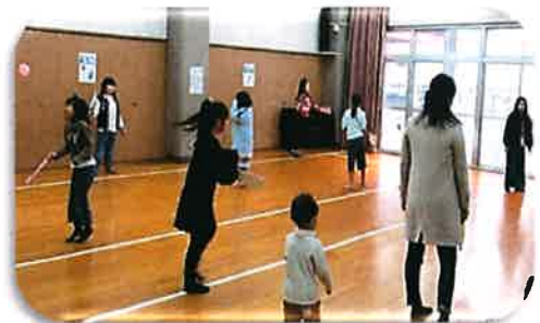
手作り遊びコーナー