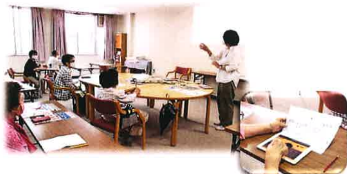
「みんなで楽しく脳トレ!」