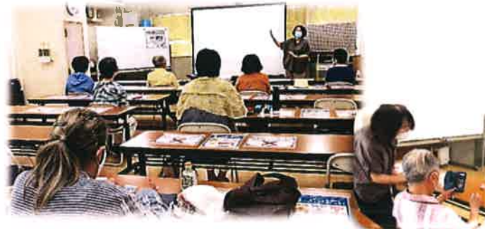
「ステップアップ スマホ講習会」