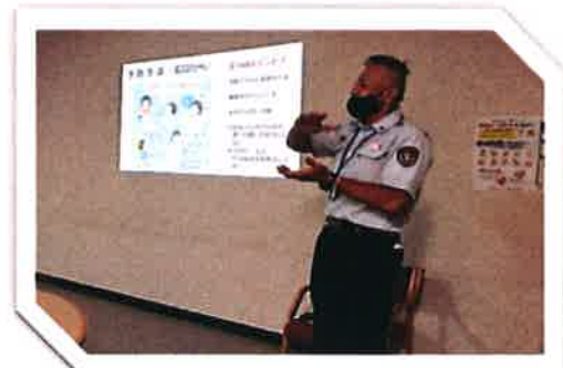
「コロナ禍での熱中症予防について」