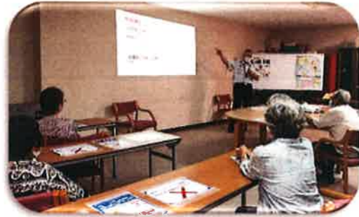
「台風による竜巻・集中豪雨に備えて」