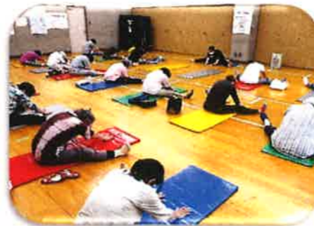
「誰にでもできるバランス運動」