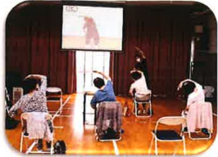
「いきいき百歳体操指導」