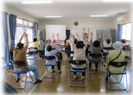
演歌にあわせて体操 北の～酒場通りには～♪

ボランティアグループ「いきいき歌体操ハートフルFo!」の皆さんが講師となり、体操に取り組んでいる場です