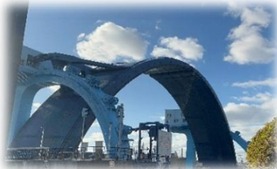
↑いつもはこんな感じ