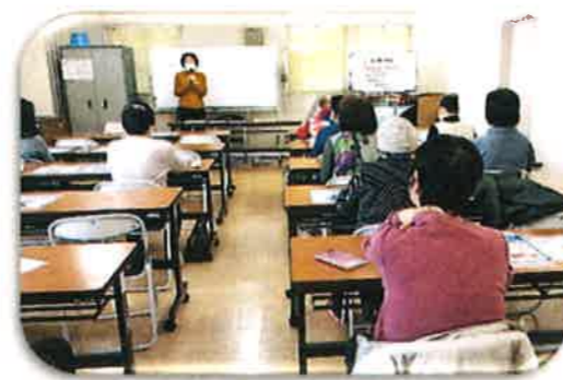
「ためになる栄養士のお話」