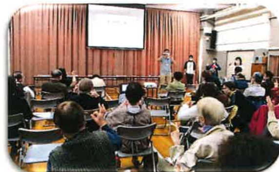
認知症サポーター養成講座