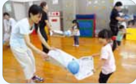
親子たいそう「上手にボールはこび」

所在地 泉尾3-9-16 TEL 06-6554-5377 URL http://www.osaka-kosodate.net/plaza/taisyo/ 開設時間 午前9時～午後9時(日曜日は午後5時30分まで) ★開設時間と事業実施時間は異なります。 休業日 月曜・祝日・年末年始(月曜日が祝日の場合は翌日も)