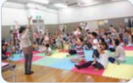
おんがくあそびをたのしんだよ～!

◆火曜日～土曜日 午前9時30分～午後2時30分(ランチOK) 月に一度、日曜日の午前中も実施しています。 0・1・2歳対象のあかちゃんマンタイムは、ゆったりほっこり過ごせます。