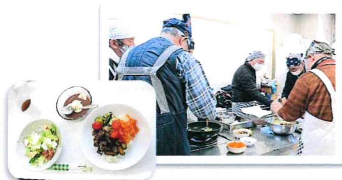
「腕まくり料理教室」