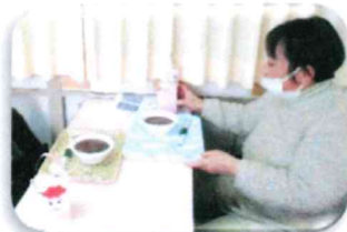
「昭和DAY!! ～みんなで楽しく昔あそび～」