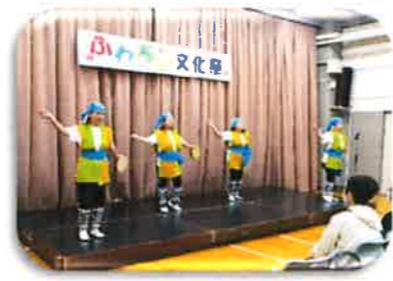
10月26日 文化祭特別イベントとして、「大人の紙芝居」「舞踊」「エイサー踊り」を披露していただきました！