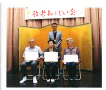
90歳の方のおたっしや表彰