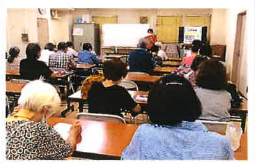
「ためになる栄養士のお話」