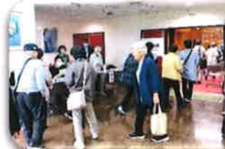
大正区コミュニティーセンター3階にて開催しました。