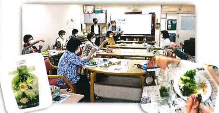
花の素材をボトルに詰めて楽しむ 「ハーバリウム講習会」