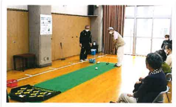
3年ぶりに開催して、とても盛り上がりました！ 「スカットボール大会」