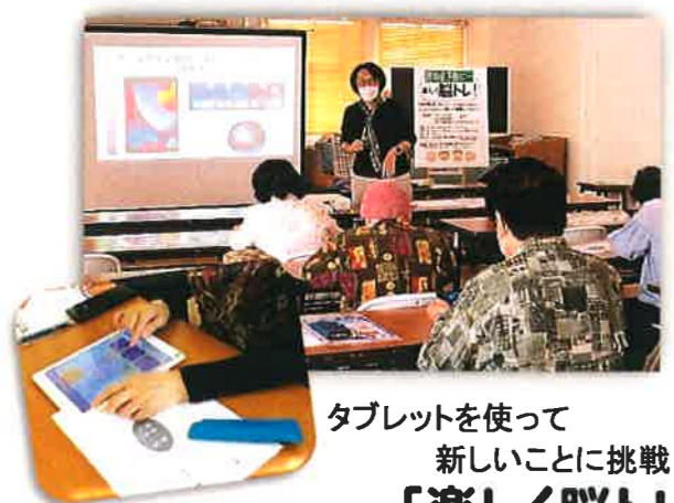
タブレットを使って 新しいことに挑戦！ 「楽しく脳トレ！」