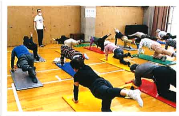
身体の歪みを直す 「整体体操」