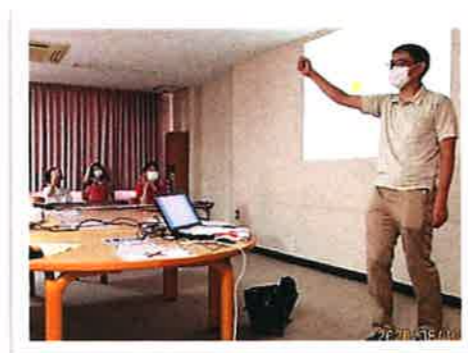
認知症について楽しく学ぼう!