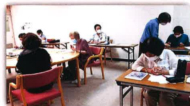
頭の体操に脳トレ!